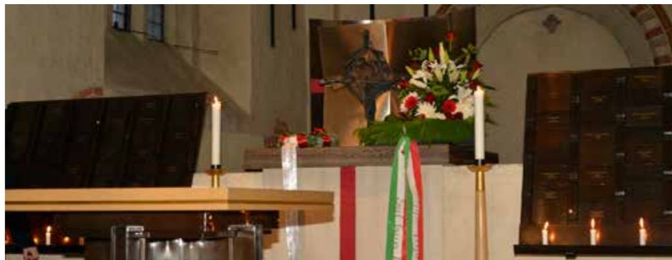
Strängnäs - Mártírok kápolnája