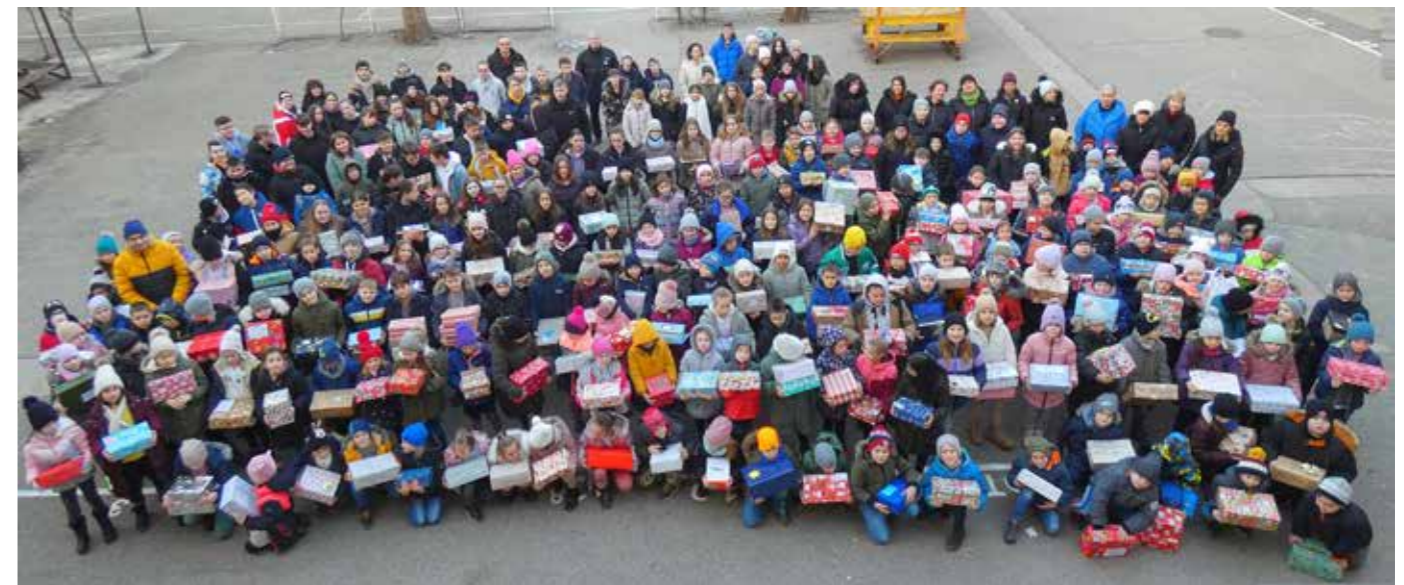
Megérkezett a Kárpátaljai Szőlősgyulára az Alföldről, a Kis Bálint Református Általános Iskola „cipősdoboz-akciójának” gyűjtéséből származó 285 karácsonyi szeretetsomag.

A Szőlősgyulai Egyházközség lelkipásztorja (Kárpátalja)