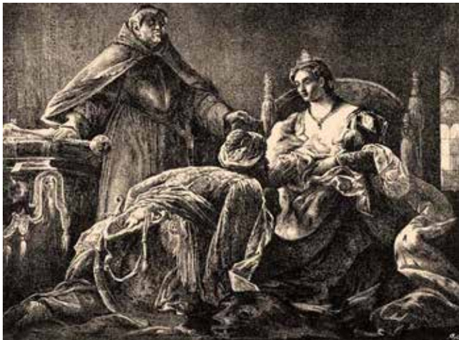
A gyermek helyett az ország ügyeit anyja, a rendkívül szeszélyes Izabella királyné és a céltudatos „ördögös barát”, Fráter György intézték

János Zsigmondot apja hívei Rákos mezején kiáltották ki királlyá, de a koronázására nem került sor, így a „Magyarország választott királya” címet viselte.