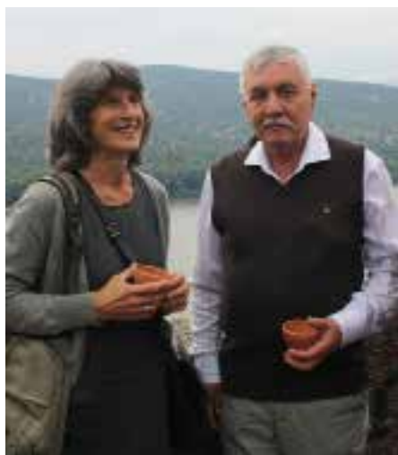
Szereposztás szerint balra Tångagärde úrnője, jobbra a SMAPEK ura, itt mindketten és mindannyian szívesen látott vendégek (Visegrádon).