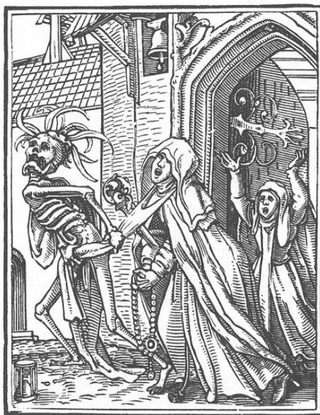
ifj. Hans Holbein: Danse macabre (Haláltánc) 15. fametszet, 1549

tárgyává. Az első terjedelmesebb tanulmányok ezekről a tüneményekről csak a 20. század 50-es éveiben jelennek meg. Sőt, még napjainkban sincs szociológus, aki ennek a tudományágatnak elismert képviselője lenne. Más szóval, a halál és a gyász szociológiája még nem találta meg az ő Keplerjét vagy Einsteinjét. Egyben szükséges rámutatni, hogy léteznek a halálnak vagy a halálközeli állapotnak nagyon kifejező szociológiai értelmezései, bár ezek sokszor pszichológusokkal vagy pszichiáterekkel vannak megfogalmazva. Csaknem tudományos paradoxon, hogy