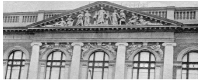
„...egy vitéz katona hősi tette: lefűrészelte a timpanon Ferenc József-szobrának a fejét.”

felállítani. Nem kaptak rá jóváhagyást. A református teológia épületében ugyan 1920 őszén beindult egy Református Tanárképző Intézet 39 tanárral és 200 hallgatóval, de ezt is a hatóságok egy évi működés után betiltották. Az egyetemi tanárok egy részét kiutasították, mások saját elhatározásból telepedtek át Budapestre, ahol az egyetem összefogva a Pozsonyból elűzött Erzsébet Tudományegyetemmel, több mint ezer beiratkozott diákkal folytatta működését. 1921. júniusában a magyar parlament törvénycikkben mondta ki, hogy ideiglenes jelleggel a pozsonyi egyetemet Pécsen, a kolozsvárit Szegeden helyezi el. A magyar állam aztán Szegeden megint kiépített egy teljes egyetemet Klebelsberg Kunó vallás- és közoktatásügyi miniszter hathatós támogatásával.