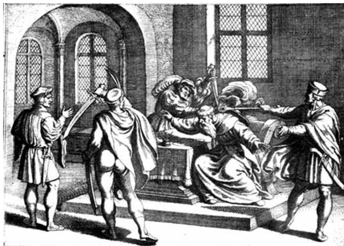
Martinuzzi Fráter György meggyilkolása abvinci kastélyában 1551. december 17. Rézkarc

így Erdélyt ezzel a közvetlen török uralom fenyegette, ami már Ferdinándot is cselekvésre készítette, és hétezeröttszáz zsoldosból álló sereget küldött Erdélybe. A sereg nem volt túl jelentős: nem véletlen, hogy a kortárs Castaldo is úgy vélekedett, hogy „követségnek elég népes, véderőnek azonban meglehetősen csekély volt”. Azonban Fráter Györgyöt, a 16. század egyik legtehetségesebb politikusát Ferdinánd katonái 1551-ben így is megölték.