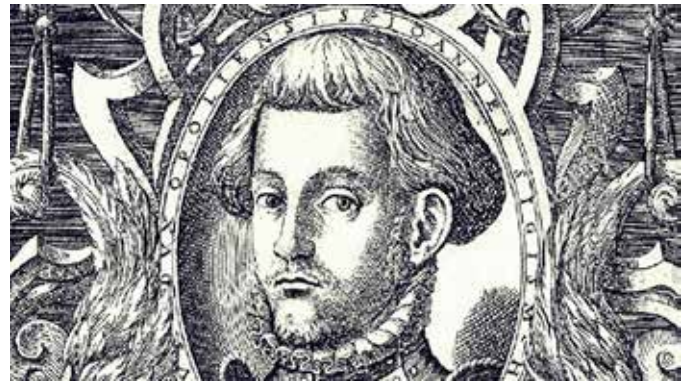
(Szapolyai) II. János Zsigmond magyar király, Erdély első fejedelme

János Zsigmond évi tízezer arany fejében megkapta a Tiszántúlt, a Temesköz és Erdély kormányzását, és ezzel az ország másfél évszázadra három részre szakadt.