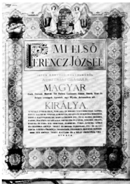
Az egyetem alapító okirata

utólagos jóváhagyásának reményében – engedélyezte a kolozsvári egyetem felállítását és megnyitását. Az országgyűlés aztán októberben ténylegesen megszavazta az 1872. évi XIX. és XX. törvénycikket az egyetem felállításáról. Akkorra azonban már az egyetemszervezés nagyjából megtörtént. Kolozsvár tehát tényleges, királyi alapítású egyetemet kapott.