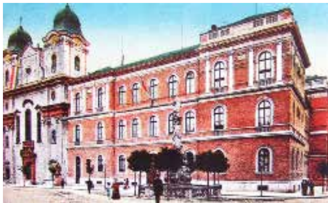
A főépület Piarista-templom felőli oldalnézete

A magyar egyetemi tanárok 1920-ban megpróbálták a magyar felekezetek támogatásával egy magánegyetemet