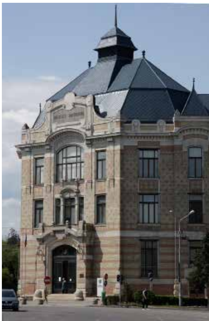
Az egyetemi könyvtár impozáns épülete