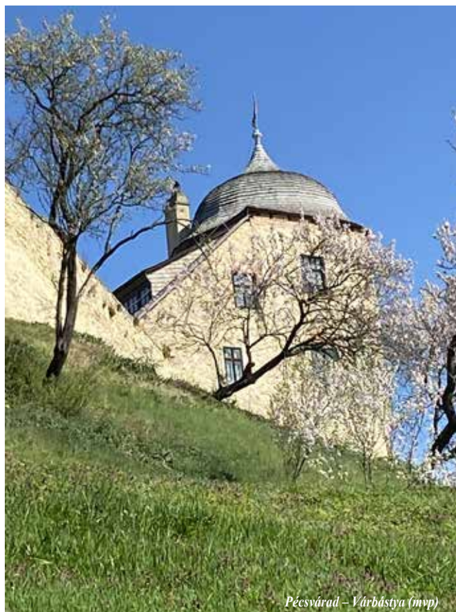
Pécsvárad – Várbástya (mvp)

AZ ÉSZAKI MAGYAR PROTESTÁNS GYÜLEKEZETEK LAPJA