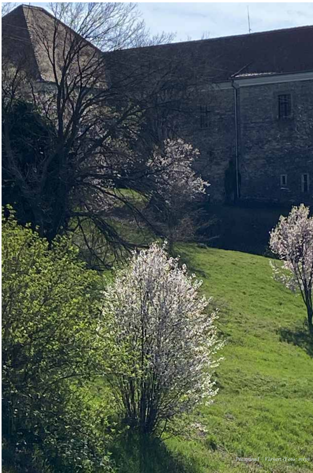
Pécsvárad – Várkert