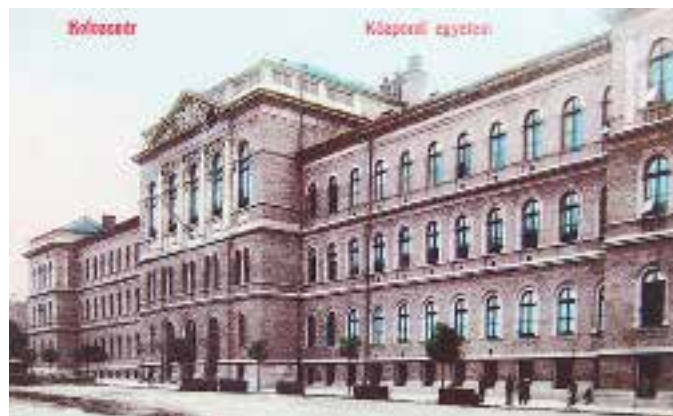
Az egyetem főépületének homlokzata

E félszázados korszak tanári karából kiemelkedik a polihisztor Brassai Sámuel, aki ugyan az elemi matematika tanszéket foglalta el, s mellesleg szanszkritot is tanított, de természet-tudósként, közgazdász-ként, filozófusként sőt muzsikusként is számon tartott. Meltzl Hugó tanártársával együtt alapította meg a világ első összehasonlító irodalomtudományi folyóiratát 1877-ben. Az orvostanárok közül Genersich Antal és Högyes Endre neve fogalom-má vált. A 20. századi tanárok sorából kiemelkedik élettani-szövet-tani kutatásaival Apáthy István, az önálló bölcsészeti rendszert kidolgozó, iskolát teremtő Böhm Károly. Kolozsvárt valóságos matematikai iskola jött létre. Alapítói Vályi Gyula és Farkas Gyula, folytatói pedig Klug Lipót, Schlesinger Lajos, Fejér Lipót, Riesz Frigyes, Haar Alfréd – akik aztán Trianon után megeremtették a magyar matematikai iskolát.