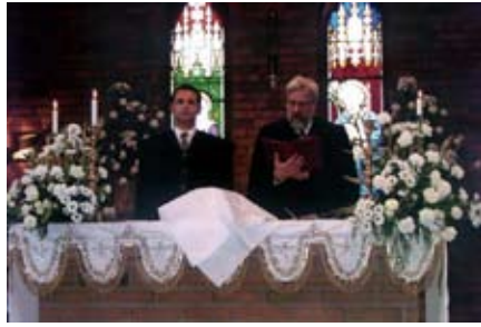
Jönköping - S:t Franciskus kat. kkan (katolikus tml.)