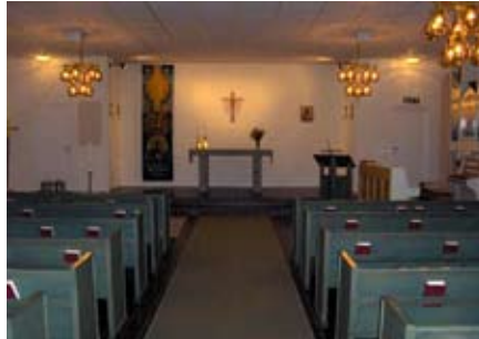
Halmstad - Andersbergskyrkan (a Svéd Egyház temploma)