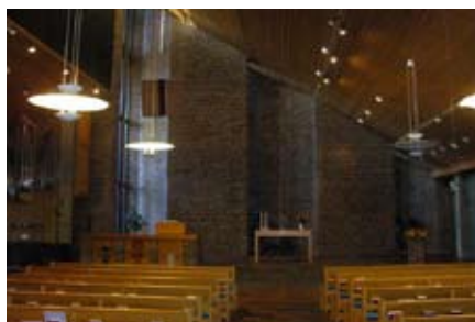
Malmö - Stadionkyrkan (Svéd Missziós Egyház)