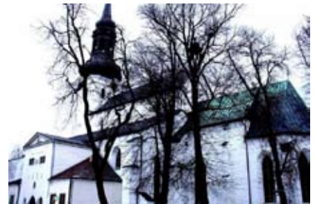
Tallinn - Toomkirik (az Észti Egyház temploma)

Kissé túlzott ezt kijelenteni, hiszen saját templomunk egy sincs az egész északi térségben, Ezzel szemben a helyi svéd (vagy éppen a finn vagy észti stb.) gyülekezetek istentiszteletek tartására készségesen bocsátják rendelkezésünkre mind templomaikat, mind gyülekezeti termeiket. Istennek legyen érte hála, s befogadóinknak pedig őszinte köszönet!