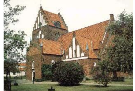
Sölvesborg - Nicolai kyrkan (a Svéd Egyház temploma)