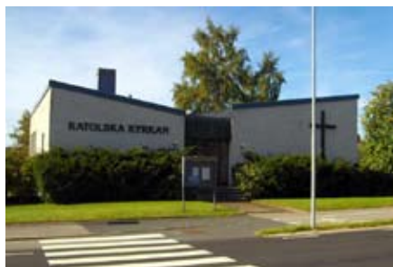
Ljungby - S:t Stefans kyrkan (katolikus tml.)