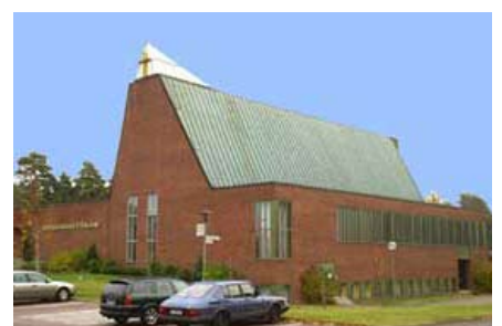
Västerås - Ansgarskyrkan (Örebro-misszió tml.)