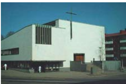
Helsinki - Alppila-kirik (a Finn Egyház temploma)