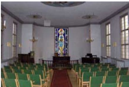
Göteborg - S:t Jakobs kyrkan (metodista templom)