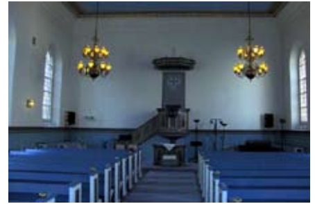
Stockholm - Franska Ref. Kkan (francia református)