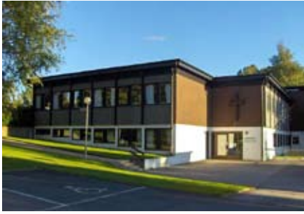
Borås - Hässleholmskyrkan (a Svéd Egyház temploma)