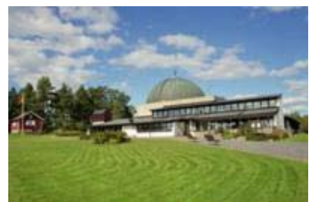
Växjö - Mariakyrkan (a Svéd Egyház temploma)