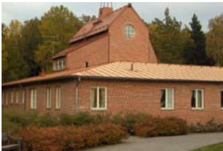
Eskilstuna - Tomaskyrkan (a Svéd Egyház temploma)