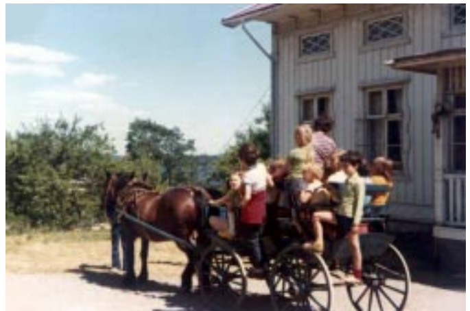
1965 - Pónifogat Tångagärdén