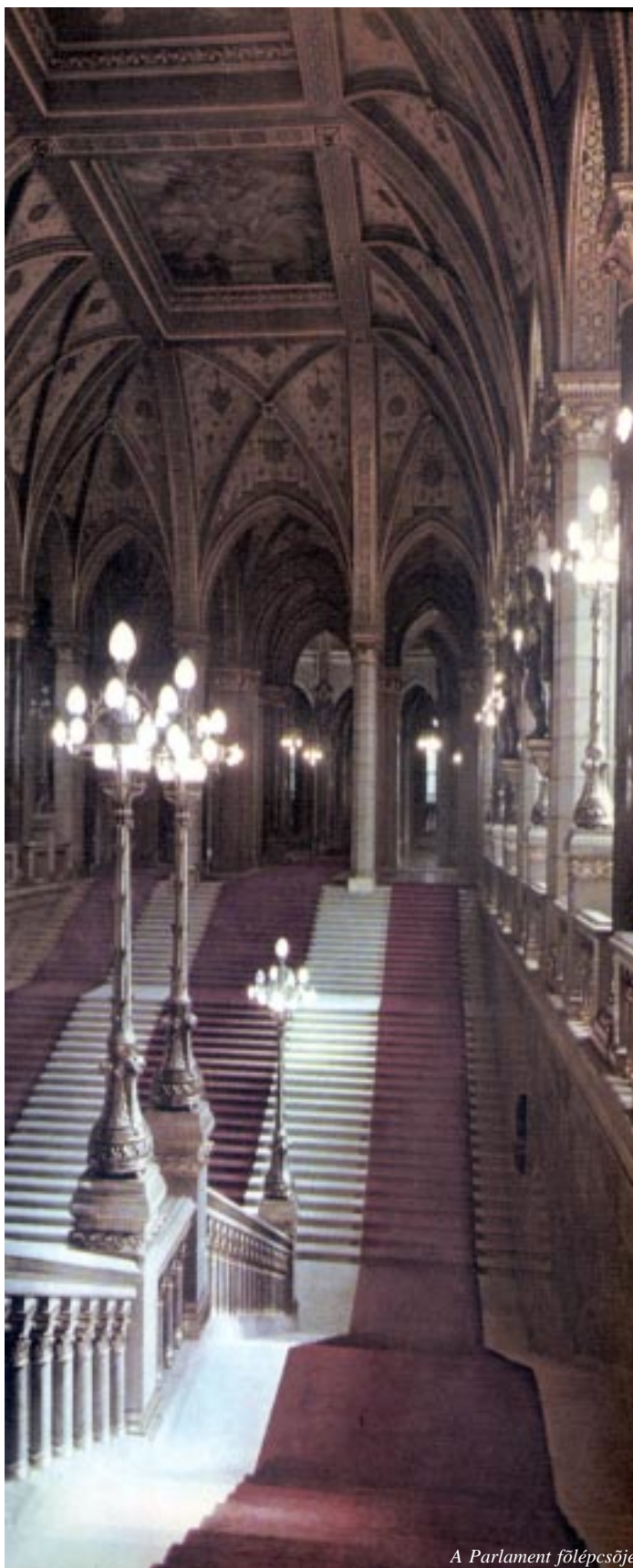
A Parlament fölépcsője

Ti, kik szívéből bálványistenek Ki nem szoríták az igaz nagy Istent, Kiknek szívében a honszeretet Mint szentegyházi oltárlámpa ég, Eredjete be és munkáljatok, Legyen munkátok oly nagy, oly szerencsés, Hogy bámultában, majd ha látni fogják, Megálljon rajta a világ szeme...!