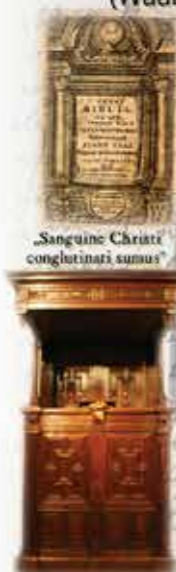
„Sanguine Christi conglutinati sumus”

Adres: Pieterskerkhof 5, 3512 JR Utrecht