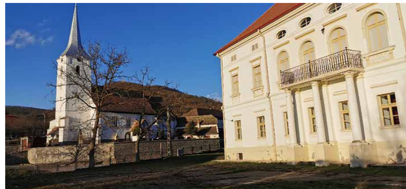
A XIII-XIV. században épült erdőszentgyörgyi (a reformáció óta református) templom, jobbra a Rhédei kastély.

(II) Erzsébet tehát brit királynő lett, Rhédey Klaudia ükunokája (4. fok). Charles herceg, ma III. Károly, Klaudia szépunokája (5. fok) már járt Erdőszentgyörgyön. S bár elvileg az angol királyi család tagjai nem politizálhatnak, 1989 áprilisában, talán a világ első prominens személyiségeként felszólt Ceausescu falurombolása ellen. Kemény szavakkal illette a diktátort, aki hazája kulturális és emberi örökségeként a falu teljeskörű lerombolását tűzte ki célul. „Nagyon nehéz csendben maradni akkor, amikor egy európai társadalom hagyományait és ősi épületeit rombolják le. Személyesen is érintve vagyok a kibontakozó tragédiában, miután az ük-ük-nagyanyám sírboltját is a megsemmisítés fenyegeti.” mvp