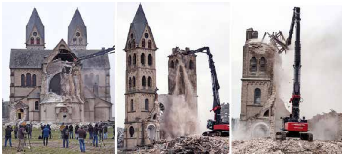
Immerath (Németország) 2018

a „szabadságharc” eszköze. De félő, hogy – miként ez már megtörtént korábban is többször – a forradalom, a szabadságharc felfalja saját gyermekeit.