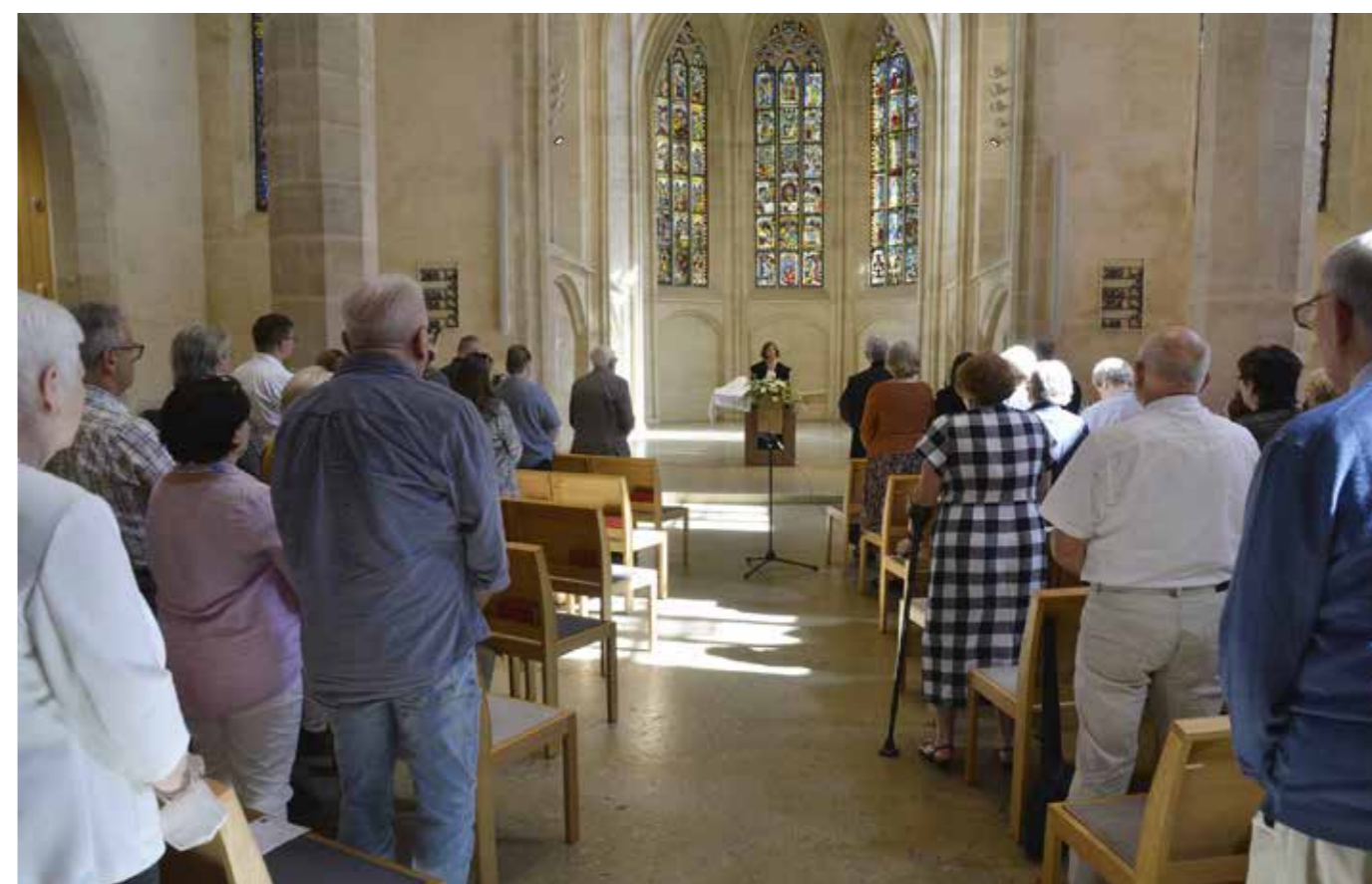
Fent: Egekbe emelkedő gótika. /Városnézés idegenvezetővel/ Lent: Istentisztelet a Szt. Márta templomban (St Martha Kirche)