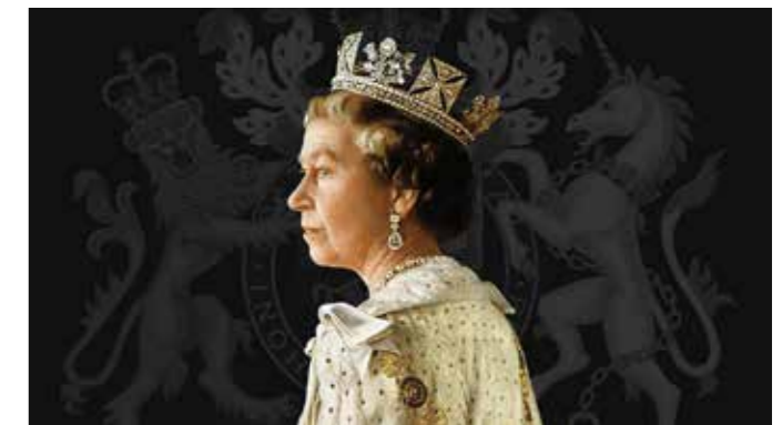
„Magam is közéjük tartozom.”

Barátja és bizalmasa, Billy Graham, az Amint vagyok (Just As I Am) című önéletrajzi írásában számolt be a királynő Biblia iránti szeretetéről, valamint keresztyén hitének