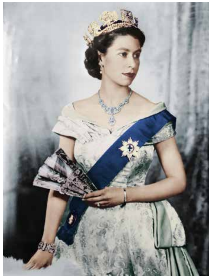
A megkoronázott II. Erzsébet

A modern kor egyetlen uralkodója sem tudta olyan méltósággal hordani a koronát, mint II. Erzsébet, minden idők leghosszabb ideig trónon lévő brit uralkodója. Ő volt a negyvenedik angol-brit uralkodó azóta, hogy Hódító Vilmost 1066 karácsonyán a londoni Westminster apátságban Anglia királyává koronázták, de egyik elődjének sem adatott meg ilyen hosszú élet és ennyi idő a trónon. A királynőt életének 97. évében, uralkodásának 71. esztendejében érte a halál nyári rezidenciáján, a skóciai Balmoral kastélyában. Halála Nagy-Britanniában a második Erzsébet-kor végét jelenti, és a szigetország nem csak a brit nemzet folytonosságát, egységét jelképező példakép elvesztését gyászolja, hanem mindazon értékek, elvek eltűnését is, amelyeknek hosszú életét és történelmi jelentőségű uralkodását szentelte. Biztos pont volt az örökké változó világban.