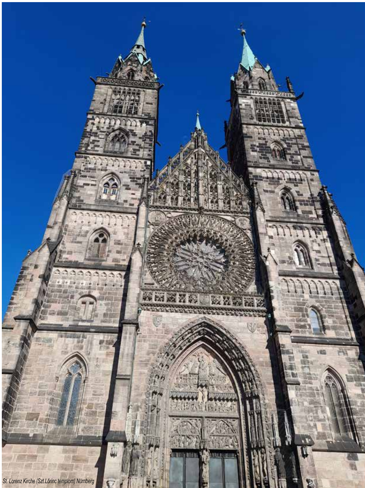
St. Lorenz Kirche (Szt. Lőrinc templom) Nürnberg

A világ része vagyok én is, mint az örök élet forrása, a természet az istenem, s én a fohásza!