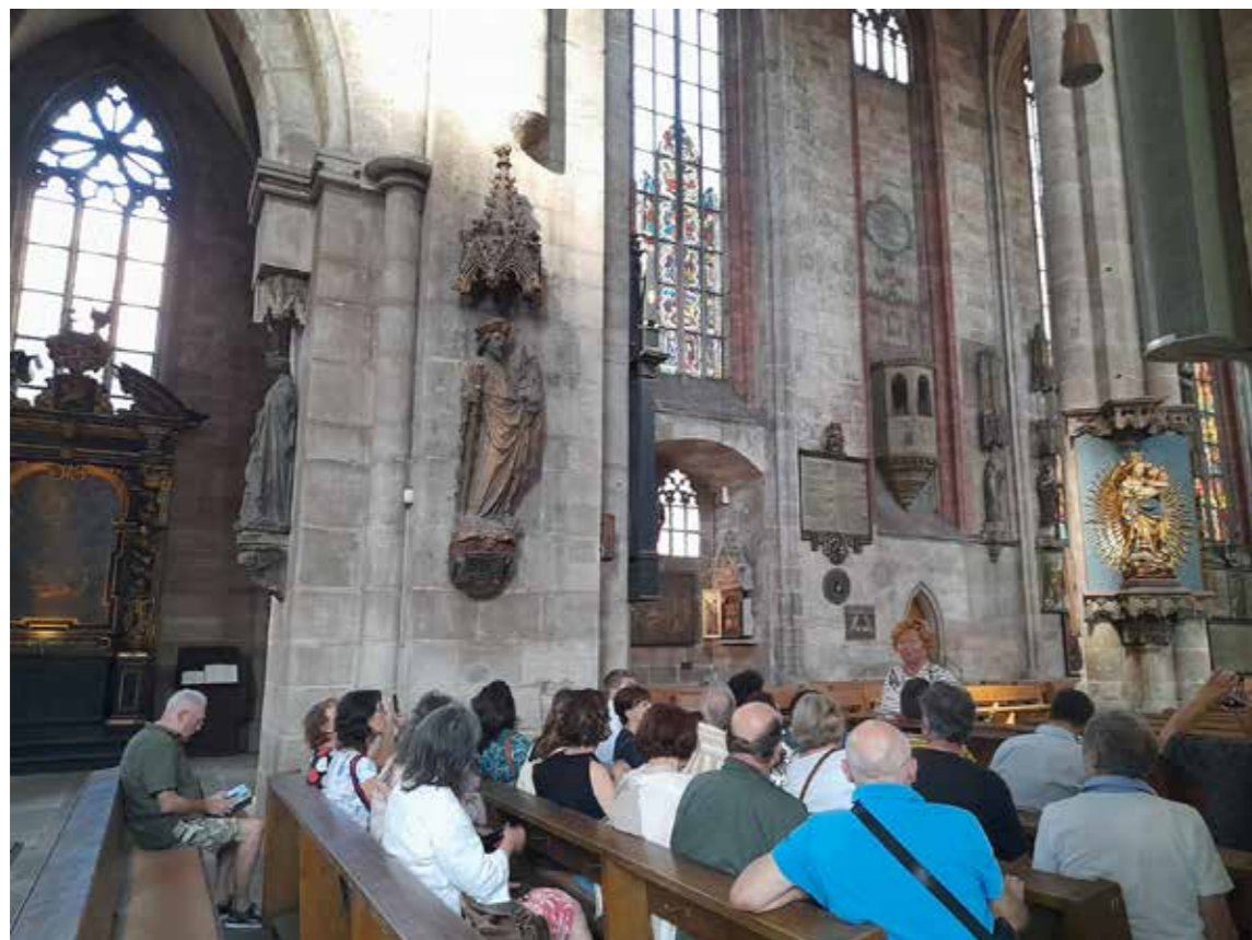
„Megállni gondolkodni, megállni, hogy körülnézzünk, lássunk. Megállni a hitben.”