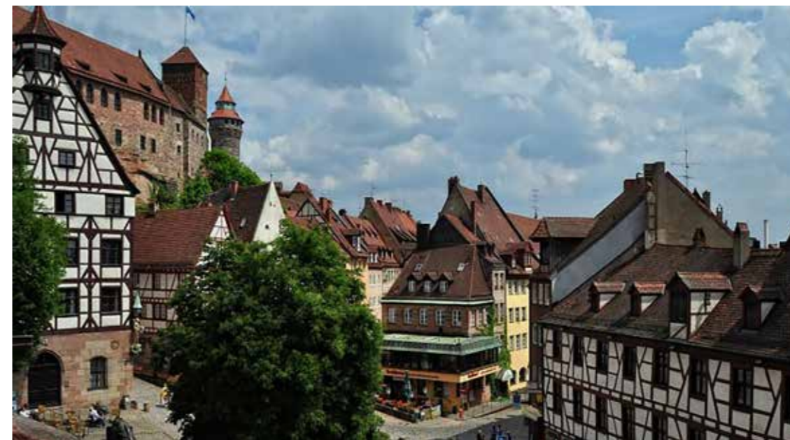
A hamvaiból és romjaiból fönixmadárként feltámadt Nürnberg nem csak újjáépült, hanem él és lüktet benne a lélek is.