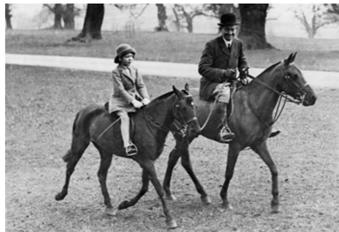
Kisgyermek korától rajongott a lovakért

II. Erzsébet uralkodásának kezdetekor még a második világháború korszakát éltük: miniszterelnöke Winston Churchill volt, a Fehér Házban Harry Truman, a Kremlben pedig még Joszif Viszarionovics Sztálin ült. Az Egyesült Királyság trónján töltött 70 éve során felépült és le is omlott a berlini fal, az emberiség eljutott a világűrbe és a Holdra, országa világbirodalomból az Európai Unió tagjává vált, majd elhagyta a közösséget.