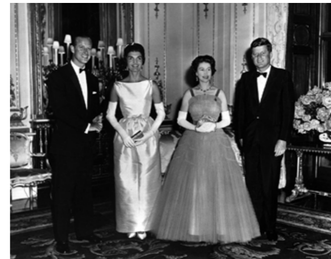
1961. II. Erzsébet fogadja John F. Kennedyt, az USA elnökét

Erzsébet híres fogadalma, amelyet 1947-ben, a 21. születésnapján mondott el a rádióban Fokvárosban, megadta későbbi uralkodásának alaphangját: „Mindnyájuk előtt kijelentem, hogy egész életemet, legyen az hosszú vagy rövid, az önök és a brit birodalmi közösség szolgálatának szentelem, amelyhez valamennyien tartozunk”.