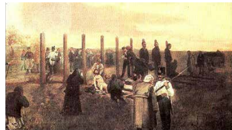
Thorma János: Az aradi vértanúk levétele a bitófáról