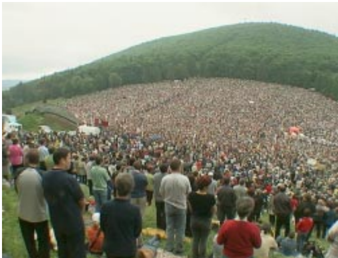
A 2006. évi csíksomlyói búcsú résztvevői a Kis-Somlyó nyergében