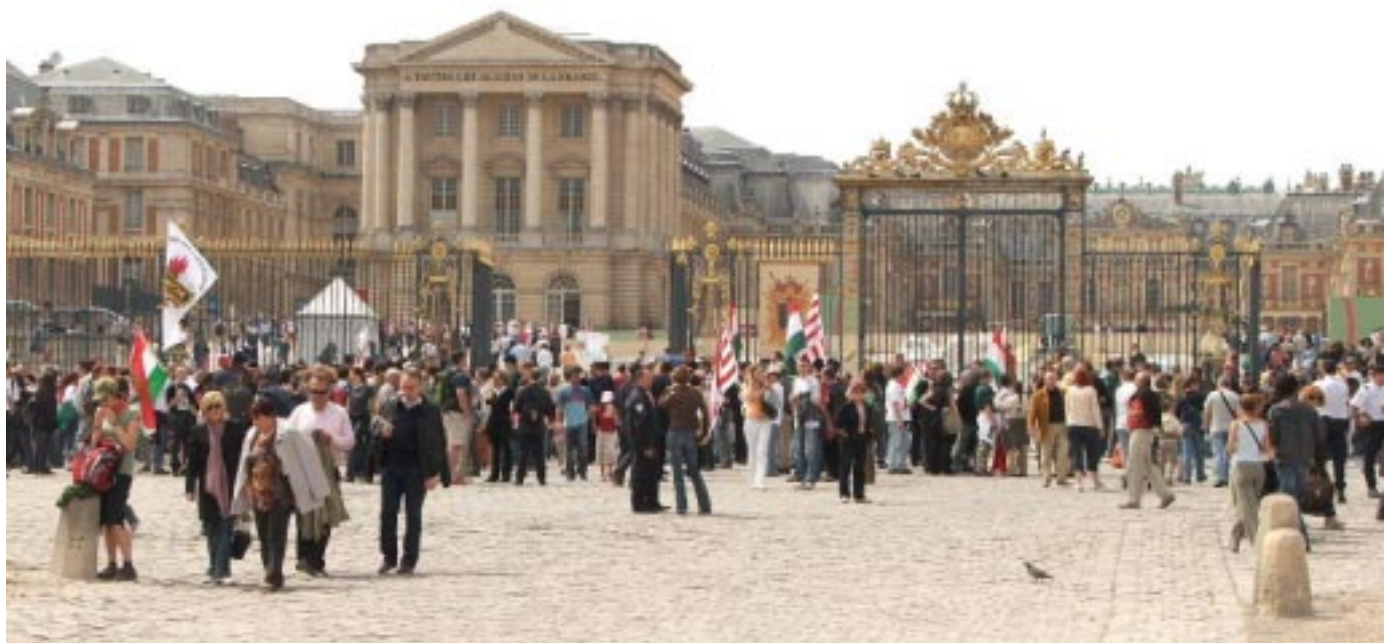
2006. június 4-én, 86 év óta először tüntettek magyarok a Párizs-környéki Versailles Kis Trianon-palotája előtt a gyalázatos trianoni diktátum ellen.