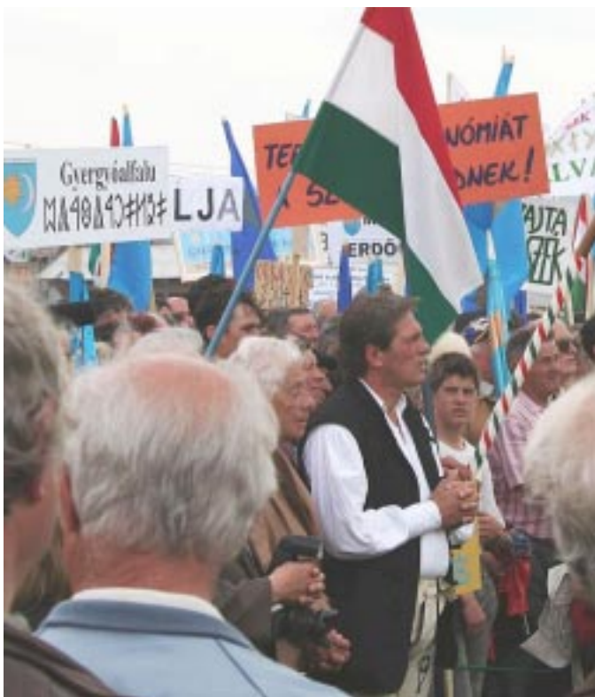
A www.erdely.ma honlap képei a gyergyóditrói székely nemzetgyűlésről