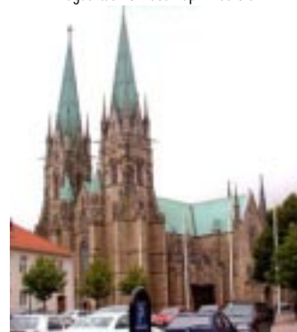
Skara, Domkyrkan Augusztus 13. vasárnap 19:00 óra