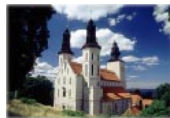
Visby, S:t Maria Domkyrkan Augusztus 2. szerda 20:00 óra

kisugárzását a halála után Németországban, az Amerikai Egyesült Államokban és Magyarországon kiadott mintegy száz műve is dokumentálja. A 20. századi európai zenetörténet e kiemelkedő alakjának emlékét Magyarországon több intézmény is ápolja: Fóton a „Gárdonyi Zoltán Református Énekkar”, Szekszárdon a „Gárdonyi Zoltán Református Együttes”, Veszprémben a „Gárdonyi Zoltán Kamarazenekar”, és Bihar-keresztesen a „Gárdonyi Zoltán Református Művészeti- és Zeneiskola”