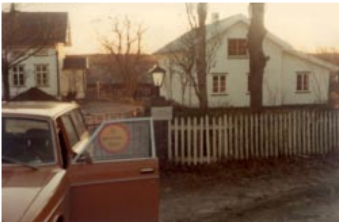
A kész otthon.