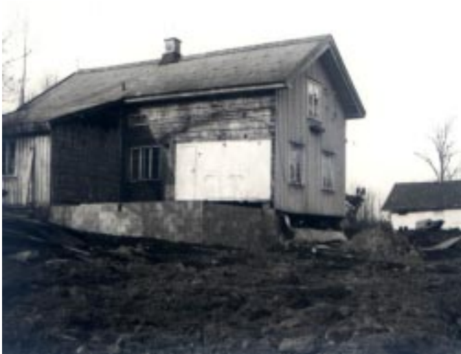
Fent: A melléképület, avagy "fiúk háza" a bővítés előtt. Ehhez épült hozzá a vízzel és csatornázással ellátott zuhanyozó-mosdó egység, valamint az alsó társalgó.