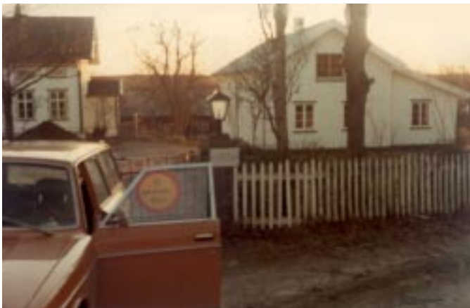
A kész otthon.