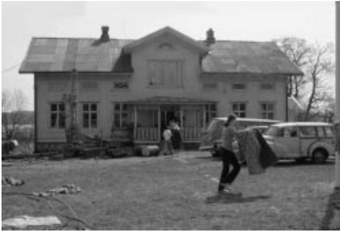
Beköltözés előtt a felújított ház.