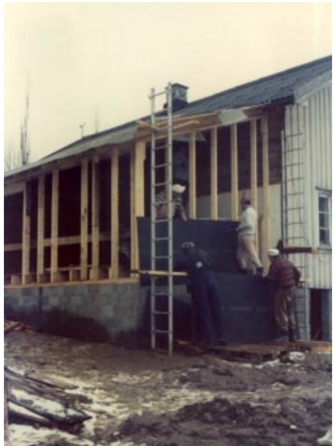
Lent és jobbra: A "kis ház" bővítése, a homlokzat és tetőzet felújítása. (Képek Koltai Rezső albumából)