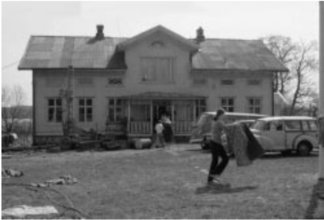
Beköltözés előtt a felújított ház.