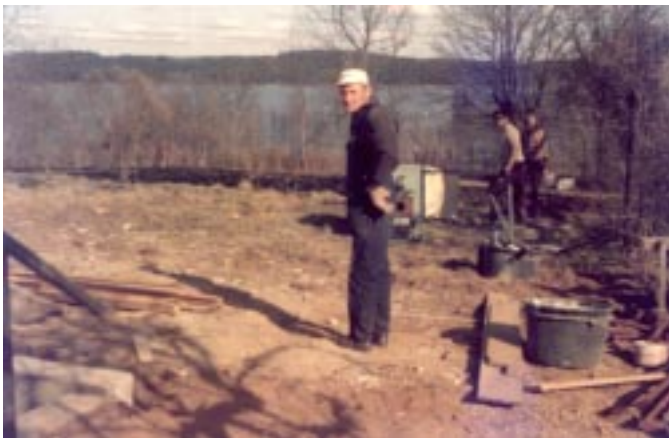
A telek tóra néző részének rendezése.

Ugyanebből a lapszámból megtudjuk: A június 8-29. közötti kiscserkész táborban "Magyar iskola" - napi két óra magyar irodalom és történelem. Társasjátékok, fürdés felügyelettel. Vallásóra. Szállás-ellátás a gyerektábor idején (szülői kíséret nélkül) 16 svéd korona. Szállás-önellátás: A gyerektábor idején kívül: felnőtteknek ágyneműhasználat 10, ágynemű nélkül 7 svéd korona. Gyermekeknek - szülői kísérettel - a részvétel ingyenes.