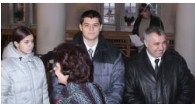
Tartu, Sankt Pauli-templom. Istentisztelet előtt a jubiláló gyülekezet.