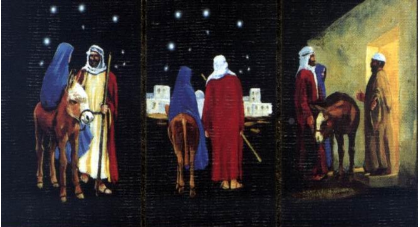
Részlet Bruce Peardon szíjfestő Evangélium című munkájából. (A Mun- och Fotmålarna egyesület képeslapja)