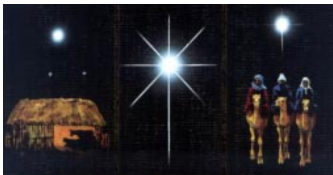
Részlet Bruce Peardon szíjfestő művéből ( Mun- och Fotmålarna )

és az éjszaka egyforma hosszú volt. Mivel a római naptárban a tavasz napéjegyenlőség március 25-e volt, következésképpen a teremtés első napja március 25-re esik. A Napot viszont Isten a negyedik napon teremtette, s a Malakiás 4: 2 ígérete szerint a Messiás az "igazság Napja", ebből következik, hogy a megígért Megváltónak március 28-án kellett világra jönnie.