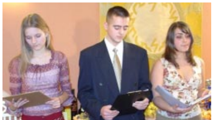
Citerás gyermekek, versmondó ifjak