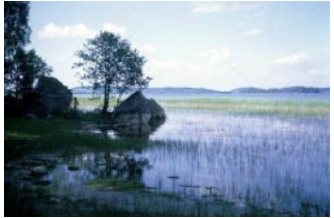
1965 - Csendélet a Tolken-tó partján