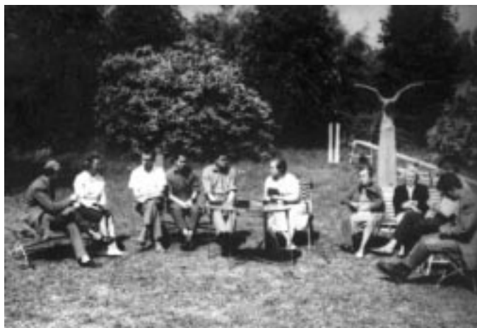
1966 - Szabadtéri bibliaóra

rendezünk, melynek keretében tapasztalatot cserélünk, vallási témákat beszélünk meg, s egyházi téren együttműködésünket mélyítjük. Együttléteinknek az itteni magyarok számára kettős szerepe van: a szabadságukat töltő szülőknek kikapcsolódást jelent, nekünk pedig alkalmat ad arra, hogy gyermekeinkkel is foglalkozzunk, átörökítve azt a magyar kultúrát és azokat a hagyományokat, melyeket új hazánkban is meg szeretnénk őrizni. Különböző tevékenységeket szervezve három jól képzett oktatónk foglalkozik a kicsinyekkel, többek között éneket és rajzot is tanítva nekik. Konferenciáinkra Magyarországról is hívunk előadókat, persze magánszemélyekként, hogy az otthoni hatóságok ne gyanítsák, mi célból jönnek ide. Jelenleg tíz olyan magyarországi látogatónk is van, akik rokonaikat látni érkeztek ide. És néhány úgynevezett "meglógott" is van közöttünk, akiket a svéd rendőrség a menekülttábor helyett egyenesen hozzánk irányított. Jelenleg mintegy hatvanan vagyunk itt, de máskor is ötven körüli a látszámunk. Legtöbbször a gyülekezeti otthon környékéről jönnek, de hétvégeken, ha csak néhány órára is, többen eljönnek közénk Boråsból, Ulricehamnából és Göteborgból is - mondja Koltai lelkész."