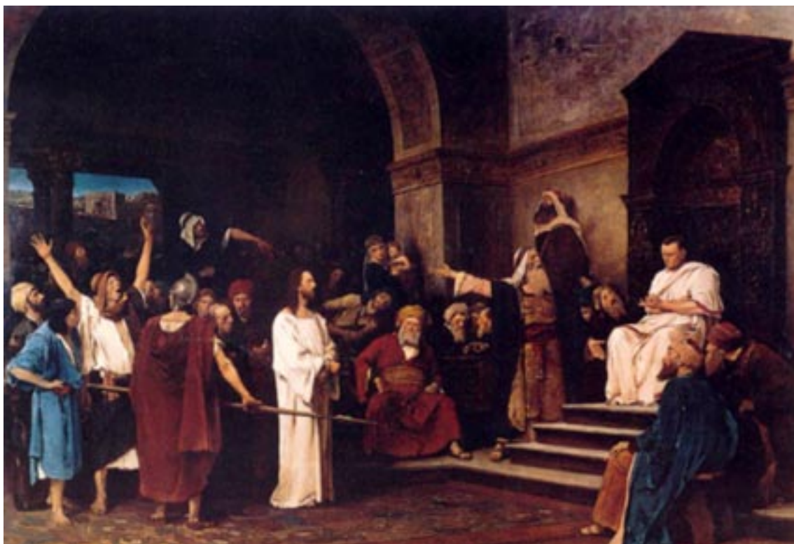
Munkácsy Mihály: Krisztus Pilátus előtt (1881)

AZ ÉSZAKI MAGYAR PROTESTÁNS GYÜLEKEZETEK LAPJA