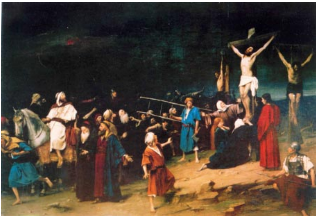
Munkácsy Mihály: Golgota (1884)