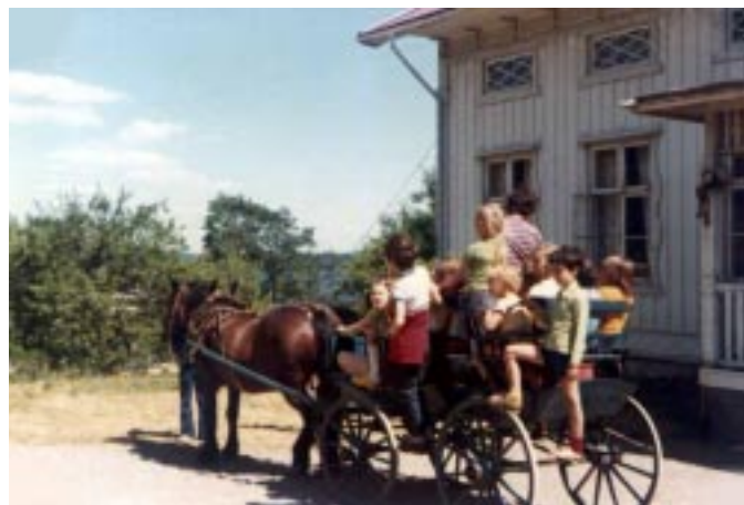
1965 - Pónifogat Tångagärdén