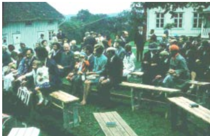
1967 - Szabadtéri előadás Tångagärdén