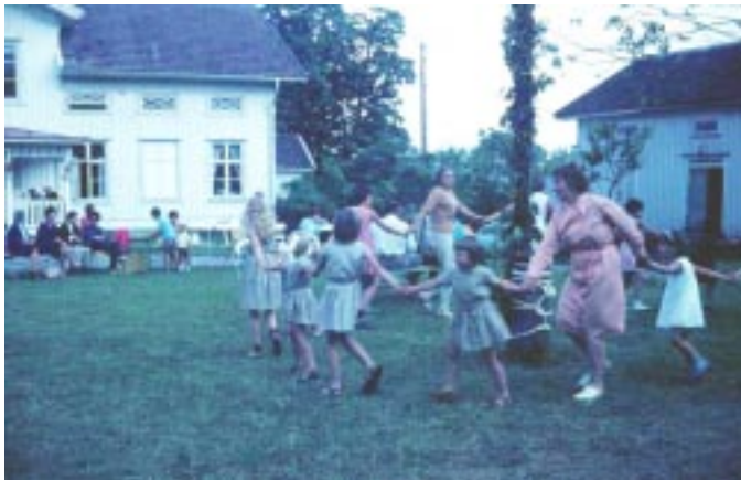
1965 - Tångagärde. Játék a májusfa körül

Néhány évvel ezelőtt, svéd támogatással, Tångagärdében gyülekezeti házat létesítettek, amely lelki otthonukká és az egyházi munkák központjává lett. Itt rendezik meg júniusban és augusztusban azokat a gyermektáborokat, ahol esetenként 20-22, hat-tizenöt éves korú gyermek vesz részt. A hitoktatáson kívül magyar történelmi, földrajzi, nyelvtani és irodalmi ismereteket nyújtanak nekik az előadók. Ezen kívül kirándulások, játék, fürdés, népdal és tánc szerepelnek a programon. A magyar gyülekezeti munkát a svéd egyház támogatja, de ez a jövőben csupán a lelkész fizetésére terjed majd ki, a dologi kiadásokat valószínűleg egyre inkább a gyülekezetek tagjainak kell vállalniuk. "Az egyháztanács ebben a helyzetben csak a hívek önkéntes adakozására számíthat" - írja a jelentés. "Ha ez az adakozás nem fokozódik, nem számíthatunk arra, hogy magyar egyházi életünket hosszabb időn át fenntarthatassuk. Noha híveink anyagi helyzete az elmúlt évek folyamán állandóan javult, ez az adományok terén sajnálatosképpen ez ideig még nem mutatkozott meg. A másik főkérdés a gyülekezeti otthon további fenntartása és fejlesztése. E téren a helyzet sokkal reményteljesebb. Elképzelésünk az, hogy a gyülekezeti ház a külföldi protestáns magyarok között is egyre nagyobb népszerűsége fog szert tenni és egyre többen fogják szabadságukat ott eltölteni."