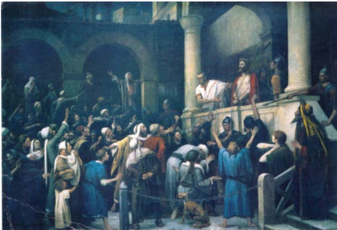
Munkácsy Mihály: Ecce homo! (1896)

Tóth Károly Antal: Nobelesdi című cikkének az Új Kéve 2002. decemberi számában való megjelenésével kapcsolatosan felmerült kérdéseket az Egyháztanács Elnöksége ez év január 17.-i gyűlésén megtárgyalta és állásfoglalását az alábbiakban foglalta össze: